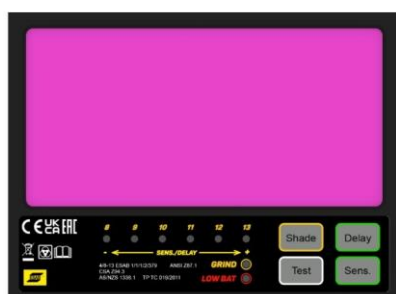
Nuovo display a LED multicolore

Per maggiori informazioni, visita esab.com .